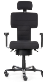
Abb. mit Sonderausstattung